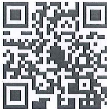
医疗器械医药代表登记表二维码